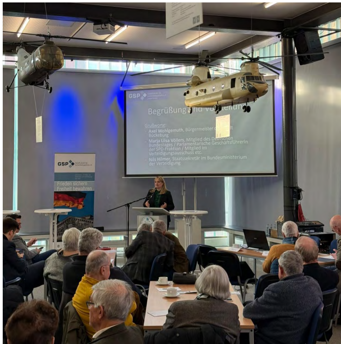
Mein Grußwort bei der Schaumburger Plattform im Hubschraubermuseum Bückeburg

Beim Gästeschießen des Reservistenverbands durfte ich zudem erleben, wie wichtig Ausbildung, Kameradschaft und Verantwortungsbewusstsein für die Sicherheit unseres Landes sind. Ein ähnliches Thema, aber ein anderer Kontext: Bei der 13. Schaumburger Plattform gab es in einem lebendigen Forum Raum für wichtige Diskussionen über Verteidigungsfähigkeit, Wehrdienst und gesellschaftlichen Zusammenhalt . Zu all diesen Terminen könnt ihr im Laufe des Newsletters mehr lesen.