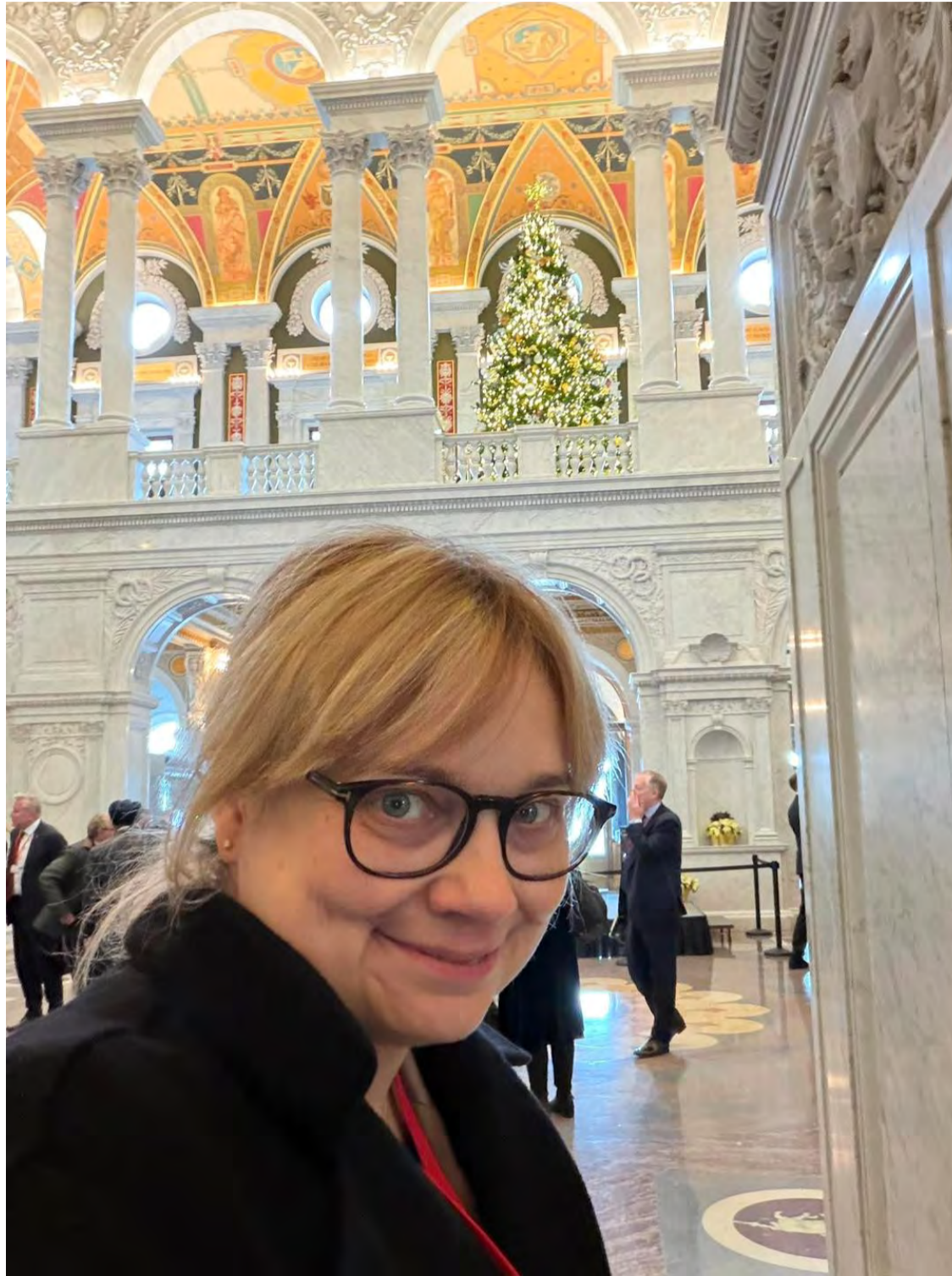
Ein Selfie zwischendurch in der Library of Congress in Washington DC

Schutz bietet – insbesondere für Menschen mit kleinen und mittleren Einkommen . Mit dem neuen Wehrdienstmodernisierungsgesetz stärken wir zugleich die Bundeswehr und schaffen attraktive Möglichkeiten für junge Menschen, sich freiwillig für die Sicherheit unserer Demokratie zu engagieren.